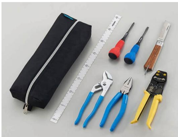
※VA線ストリッパー P-958(ホーザン)

※弊会が販売する工具セットの内訳：①～⑧まで各 1 個（ドライバーは＋，－各 1 個） 工具は、すべてホーザン製です。下の画像はイメージとなります。ホーザンの変更により同じ形色ではない場合がございます。